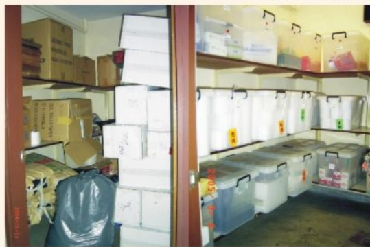
● 實施五常法前及後對照 Ho Man Tin Ambulance Depot is among the pilot units to adopt 5-S Practice