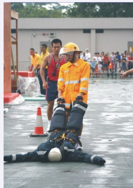
● 消防鐵人賽中障礙賽的假人重90公斤 Participants will carry a 90 kg dummy in the obstacle run of the Toughest Fire-fighter Alive in WFG 2006

有關大賽詳情可登入第九屆世界消防競技大賽網頁溜瀆，網址： www.worldfirefightersgames2006.hk 。