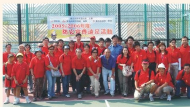
● 離島區防火委員會遠足活動 A hike organised by the Island District Fire Safety Committee