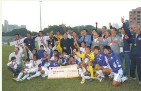
● 處長頒獎後與足總代表及傑志球員合照 The HK Football Association League Cup Final cum WFG 2006 Promotion Day

當日並加插一場序幕賽，由「消防之友隊」對「香港足總元老隊」。「消防之友隊」由消防處的高級官員、足球隊成員及傑志球會的成員組成，與由足球總會多名前任會長及退役香港足