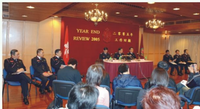
● 處長在記者會中回顧過去一年的工作 D hosts a year-end media briefing

救護召喚。為改善緊急救護服務，本處計劃進行顧客服務問卷調查，以了解市民的需求，希望能提供最佳服務。