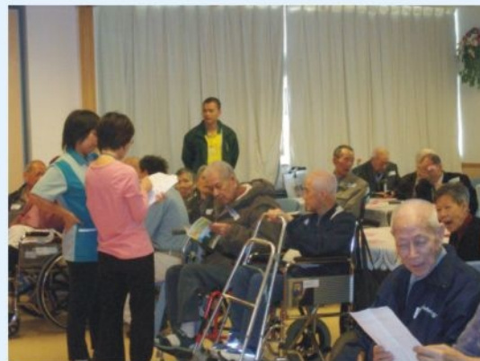
● 義工協助長者參加活動 F. S. volunteers help out in activities organised by Fong Shue Chuen Home for the Aged

當日活動上午九時開始，義工負責在場照顧長者，接待長者及其家人，幫助殘障人士去洗手間，並協助長者進食及玩遊戲等。除了有豐富的表演及遊戲節目外，各長者都